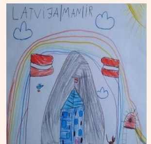
Amēlija Pavlova, 1.a