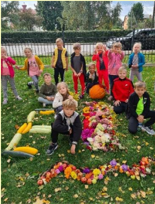
Pēc kopā padarīta darbiņa