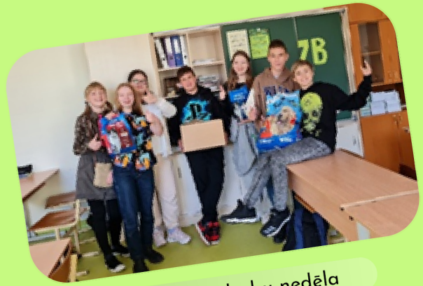
Labo darbu nedēļa

Mēs esam aktīvi, draudzīgi, zinātkāri, arī sportiski jaunieši, kuri aktīvi iesaistās skolas piedāvātajos pasākumos - Labo darbu nedēļā veicām ģenerālo tīrīšanu klasē un savācām kaķu un suņu barību patversmes dzīvniekiem; "Naudas stundā" iesniedzām savas ekskursijas maršrutu un izmaksas. Mūsu klases moto: "Kas neriskēs, tas nevinnēs!"