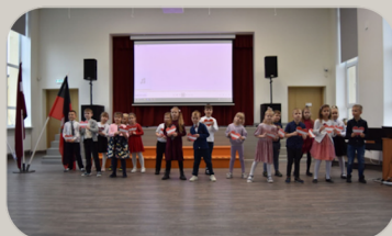
Rakstu sagatavoja Artjoms Kozlovs