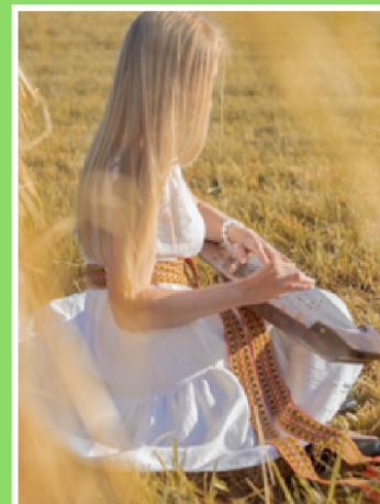
Ļoti patik kokles skaņas

Šobrīd ar lepnumu varu teikt - mācījos Gārsenes pilī, jo tolaik Gārsenes pamatskola atradās pils telpās. Tajā laikā tas nemaz nelikās kas īpašs. Tagad gan. Man patika zīmēt. Patika angļu valodas stundas. Par mūziku gan nevarētu teikt, ka tas bija mans mīļākais mācību priekšmets. Bet man ļoti patika dziedāt. Un kopš mazākajām klasēm biju pārliecināta - būšu skolotāja. Tikai nevarēju izlemt -angļu valodas vai mūzikas. 9.klasē mācoties, sāku braukt uz Jēkabpils mūzikas skolu un apgūt dziedāšanu. Tad arī bija skaidrs, ka tā būs mūzika.