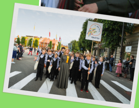
XI Latvijas zēnu kora salidojums Cēsīs 2023. gada maijā