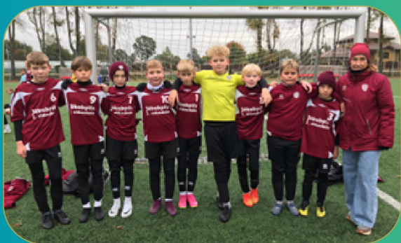
2010.-2011.gadā dzimušie zēni 1.vietā Jēkabpils novada lielo skolu grupā