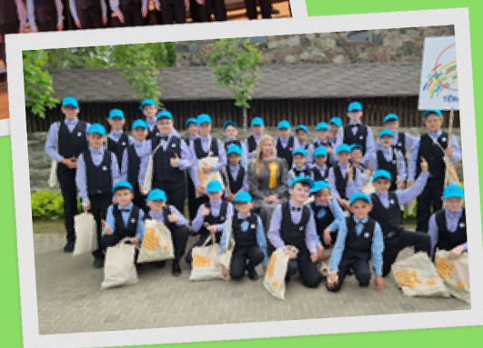
Zēnu kora konkursā Daugavpils Vienības namā